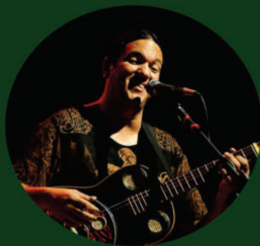
Bandleader, Múlti-instrumentista, e Compositor

O artista utiliza o pseudônimo Canta Curumim para o seu trabalho artístico de músicas infantis.