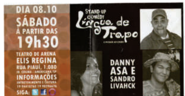
CARTAZ DE SHOW COM DANNY ASA