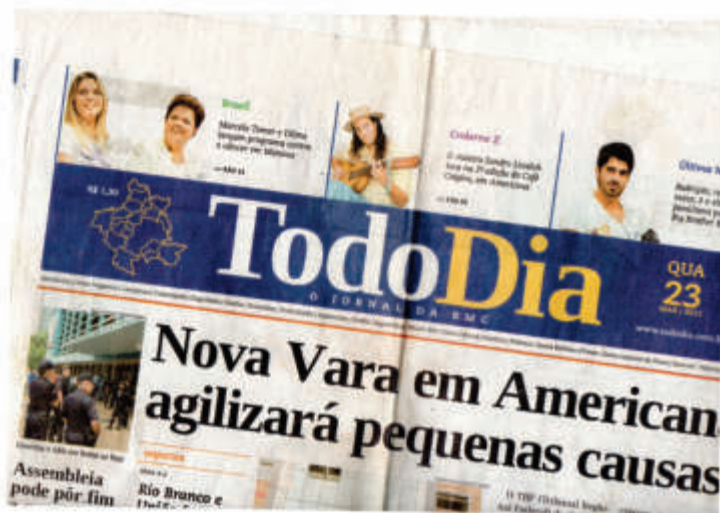
CAFE COM VIOLA AMERICANA 2011