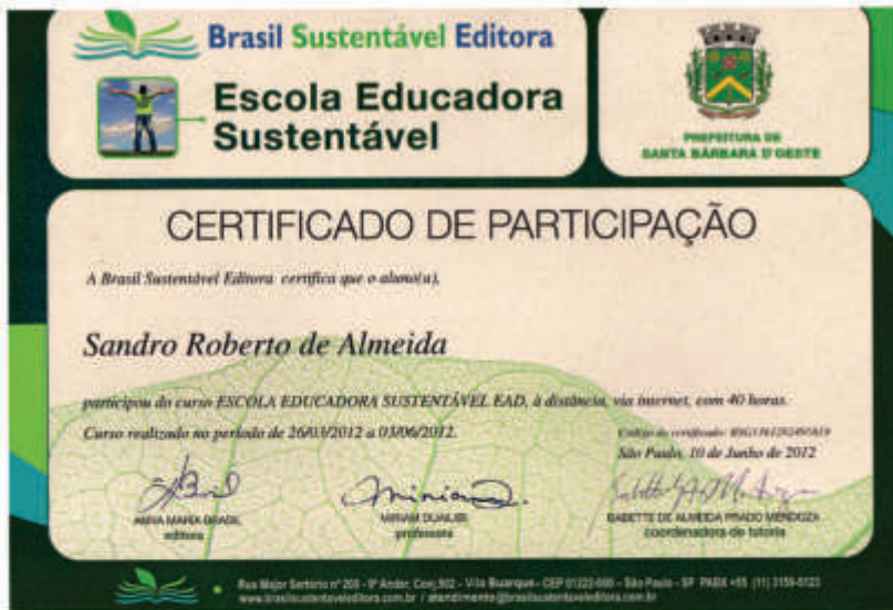
BRASIL SUSTENTAVEL SBO